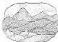
4. volcanic eruption